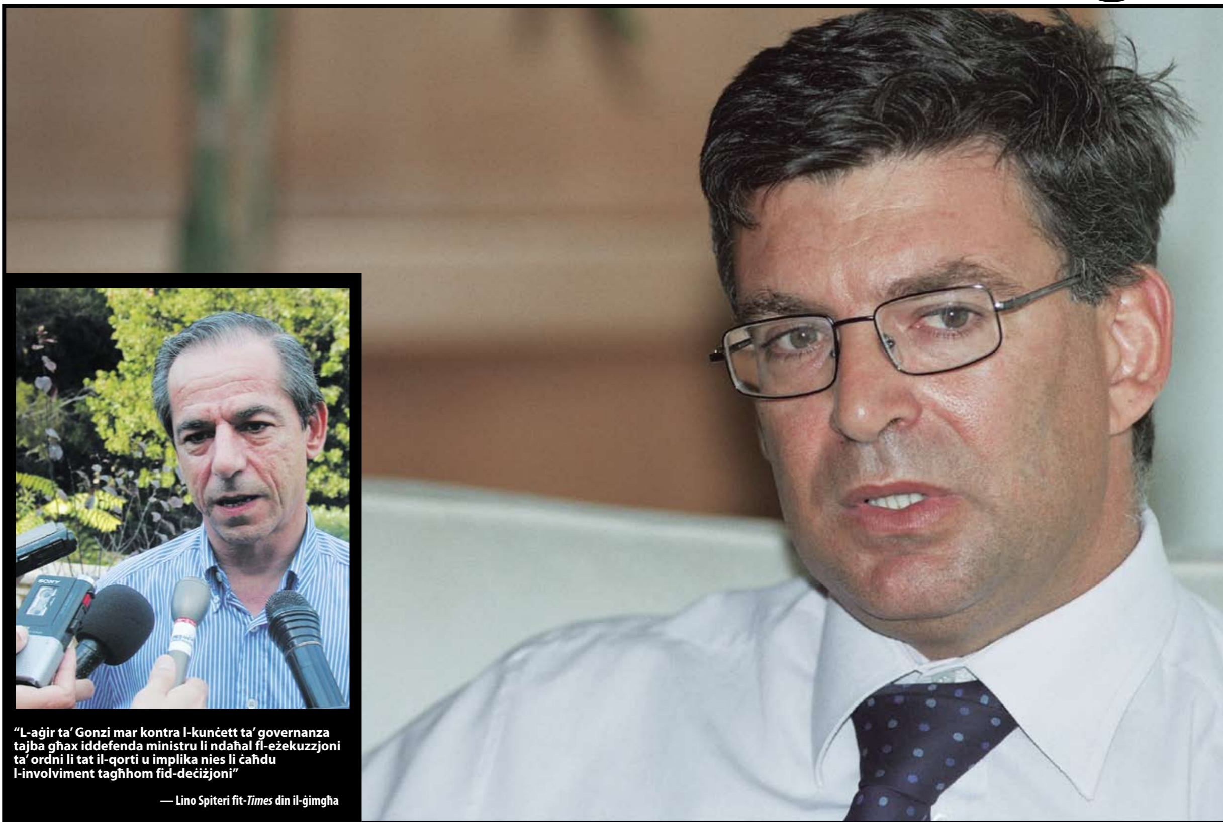
"L-aġir ta' Gonzi mar kontra l-kunċett ta' governanza tajba għax iddefenda ministru li ndaħal fl-esekuzzjoni ta' ordni li tat il-qorti u implika nies li ħadhu l-involvement tagħhom fid-deċiżjoni"