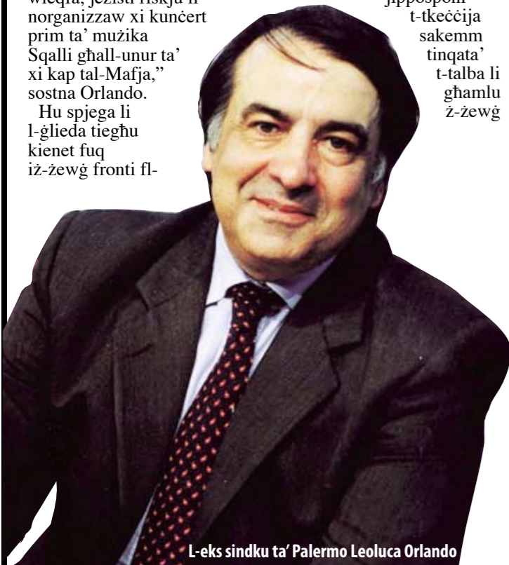
L-eks sindku ta' Palermo Leoluca Orlando